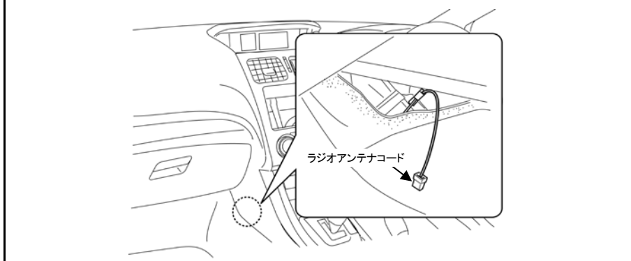
車両側ラジオアンテナコードの位置