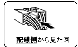
オプションコネクタ3P(緑)