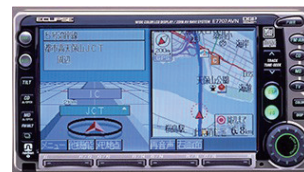
約2年の開発期間をかけ誕生した、初代AVN

以来、ナビとしての使いやすさはもちろん、外部の情報をクルマに取り込んだ「つながる機能」やAVNとドライブレコーダーを融合させた「録ナビ」も誕生。ドライブをもっと楽しくアクティブに、安心を支援するための機能・サービスをいち早く取り入れながら進化を続けてきました。